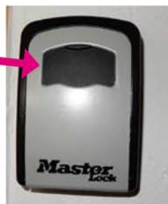
1| Aufbewahrung der Hausschlüssel.