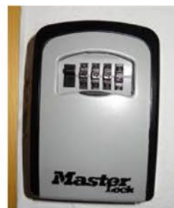
2| Deckel offen.